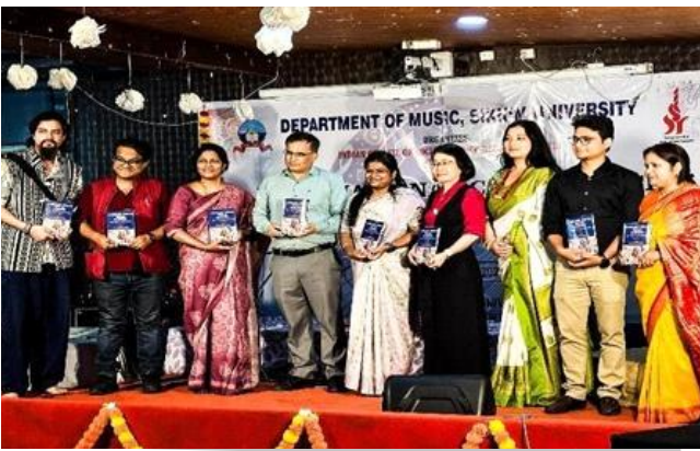
पुस्तक का लोकार्पण