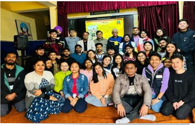
भारतीय ज्ञान व्यवस्था