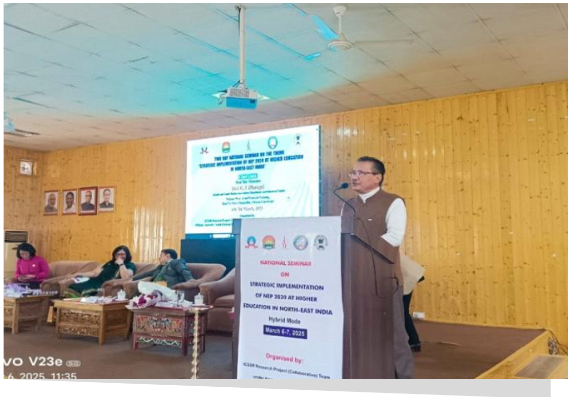
पूर्वोत्तर भारत में उच्च शिक्षा पर एनईपी 2020 के रणनीतिक कार्यान्वयन पर दो दिवसीय राष्ट्रीय संगोष्ठी