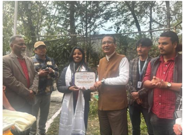
प्लेट 2: माननीय कुलपति, सिक्किम विश्वविद्यालय द्वारा सम्मान