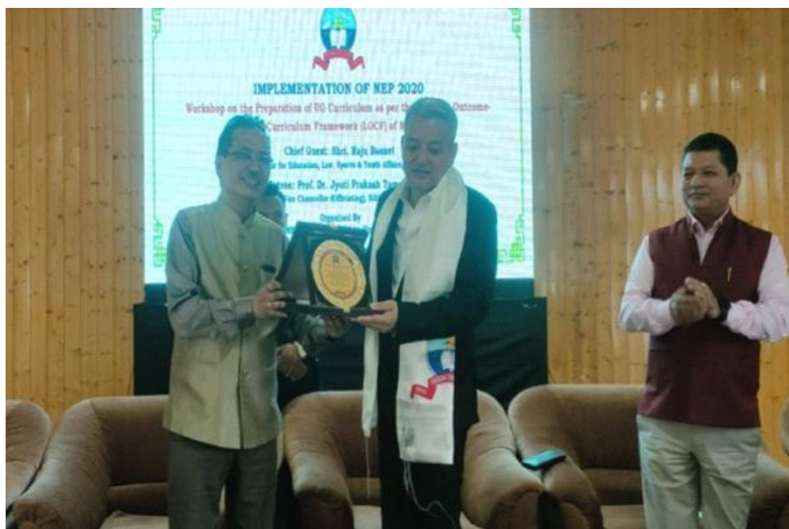
स्नातक पाठ्यक्रम तैयार करने पर कार्यशाला