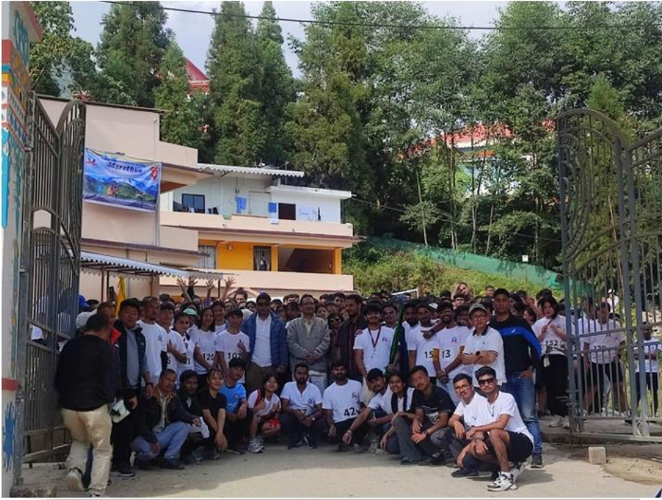
फोटो 1: मैराथन के प्रतिभागी कुलपति के साथ गर्व से पेश