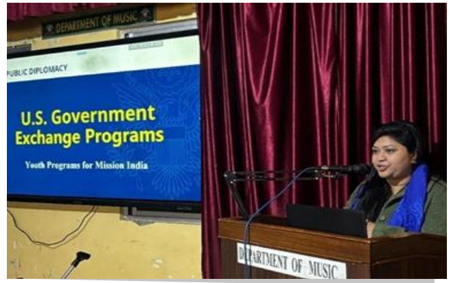
अमेरिकी सरकार विनिमय कार्यक्रम