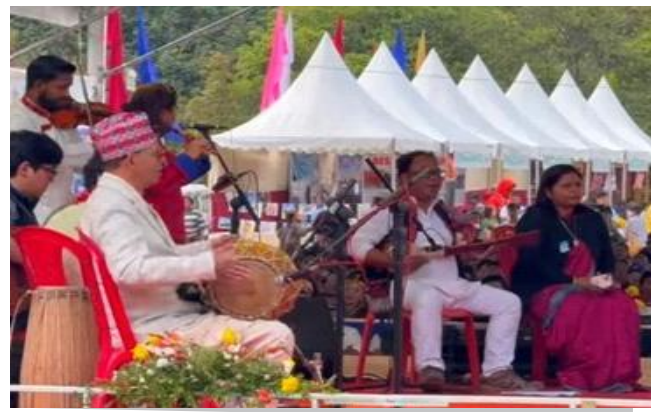
यांगयांग परिसर में सिक्किम विश्वविद्यालय के पर्यटन विभाग द्वारा आयोजित यूथ कॉन्क्लेव में संगीत विभाग के संकाय और छात्रों ने प्रस्तुति दी