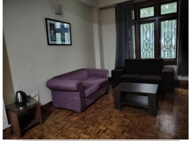
विश्वविद्यालय अतिथि गृह के कमरे