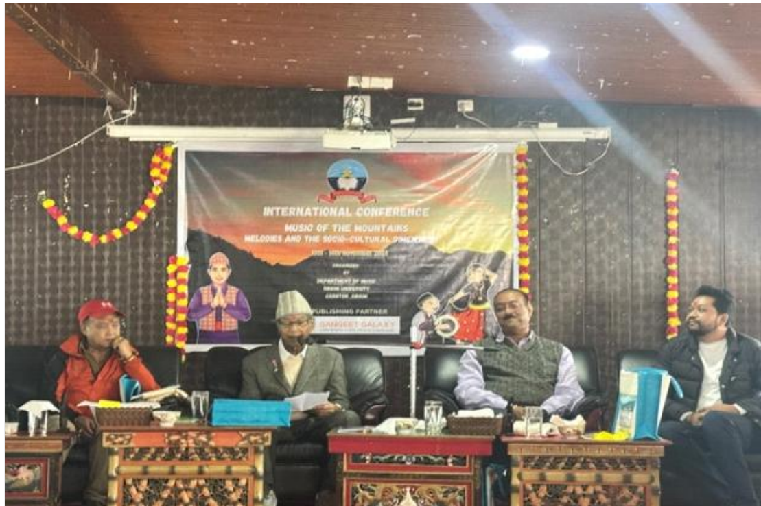
संगीत विभाग द्वारा आयोजित "द म्यूजिक ऑफ द माउटेन्स" पर अंतर्राष्ट्रीय सम्मेलन