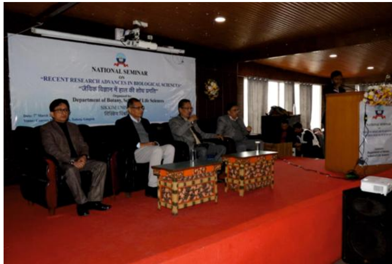
चित्र : 7/3/2025 को "जैविक विज्ञान में हालिया शोध अग्रिम" पर वनस्पति विभाग, सिक्किम विश्वविद्यालय द्वारा आयोजित राष्ट्रीय संगोष्ठी।

19. विभाग/केंद्र/विश्वविद्यालय द्वारा आयोजित कल्याणकारी गतिविधियाँ और परोपकार (यदि कोई हो)