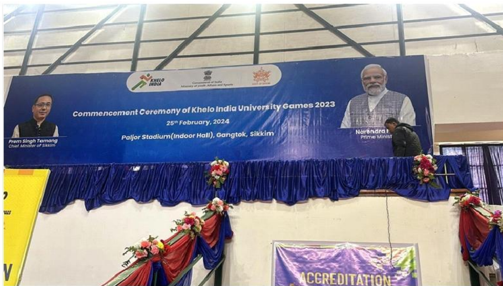
फोटो प्लेट 8: खेलों के माध्यम से युवाओं को सशक्त बनाना! खेलो इंडिया यूनिवर्सिटी गेम्स में सिक्किम के मुख्यमंत्री और प्रधानमंत्री का सम्मान