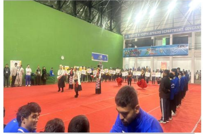
फोटो प्लेट 5: एथलेटिक उत्कृष्टता का जश्न मनाते समय हमारी जड़ों को गले लगते हुए! खेलो इंडिया यूनिवर्सिटी गेम्स में सिक्किम विश्वविद्यालय की उपलब्धि की चमक