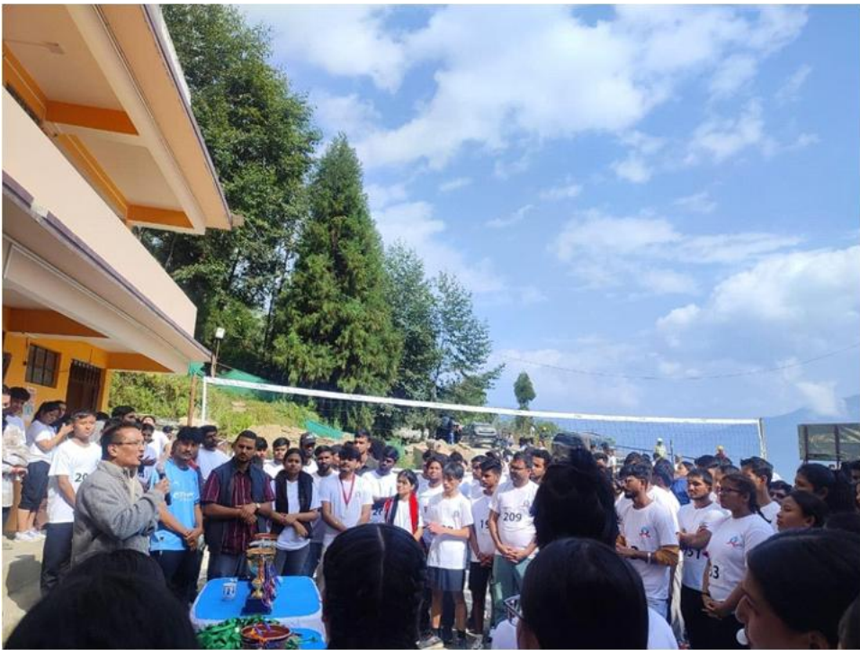
फोटो 2: सिक्किम यूनिवर्सिटी मैराथन 2024 में प्रतिभागियों को प्रेरित करते हुए, कुलपति