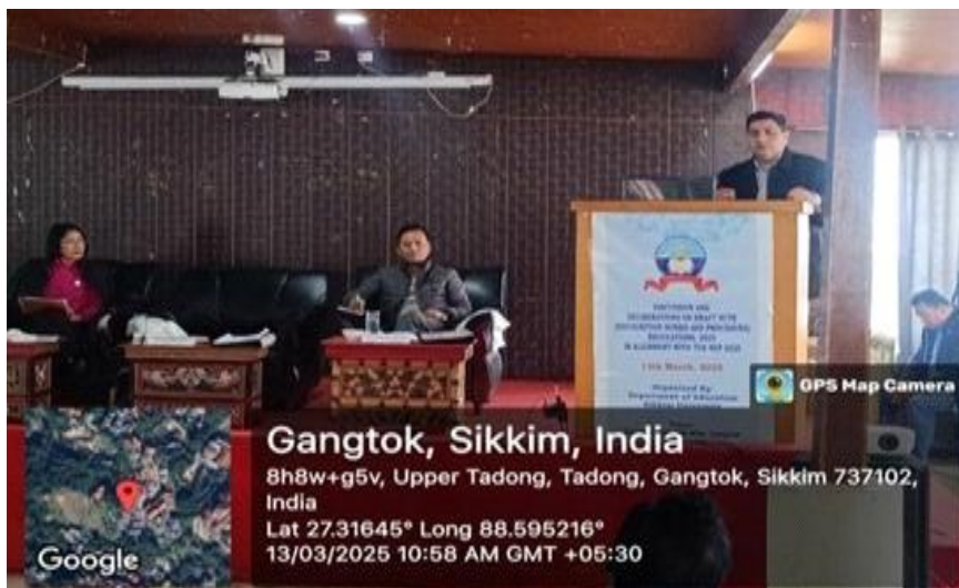
एनईपी 2020 के अनुरूप एनसीटीई (मान्यता मानदंड और प्रक्रिया) विनियम, 2025 के मसौदे पर चर्चा और विचार-विमर्श पर संगोष्ठी