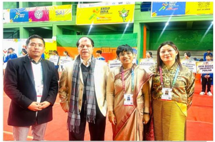
फोटो प्लेट 7: सीमाओं से आगे बढ़कर महानता की प्राप्ति! खेलो इंडिया यूनिवर्सिटी गेम्स में सिक्किम विश्वविद्यालय के गौरवपूर्ण प्रतिनिधियों से मुलाकात