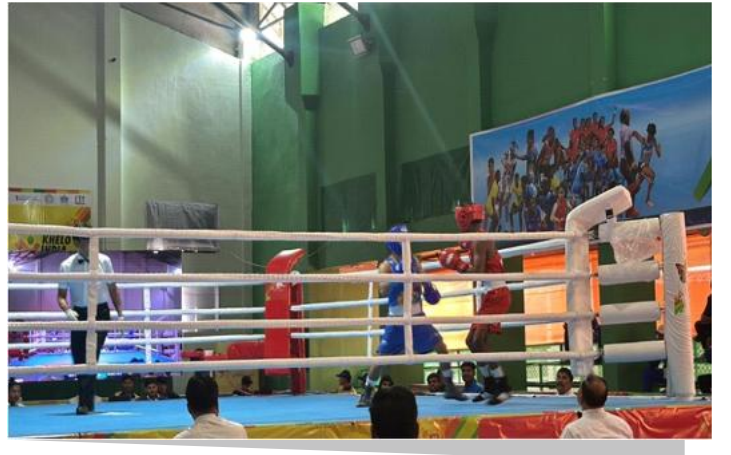
फोटो प्लेट 4: विभिन्न विश्वविद्यालयों से मुक्केबाजी चैंपियनशिप