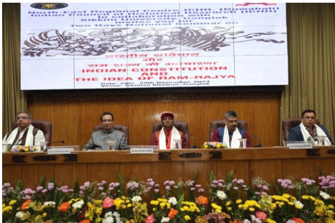
भारतीय संविधान और राम राज्य के विचार पर दो दिवसीय राष्ट्रीय संगोष्ठी