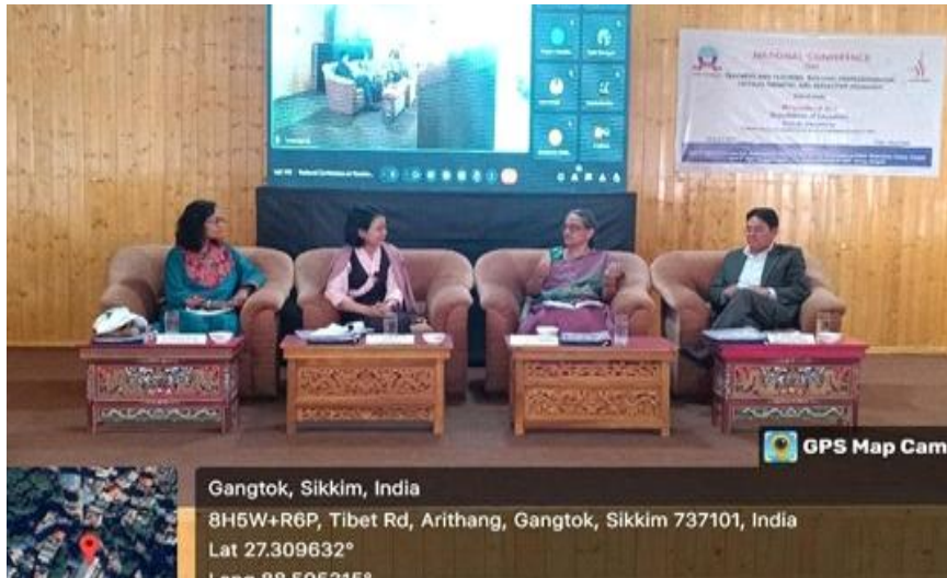
शिक्षक और अधिगम : व्यावसायिकता का निर्माण, आलोचनात्मक सोच और चिंतनशील शिक्षाशास्त्र पर राष्ट्रीय सम्मेलन :