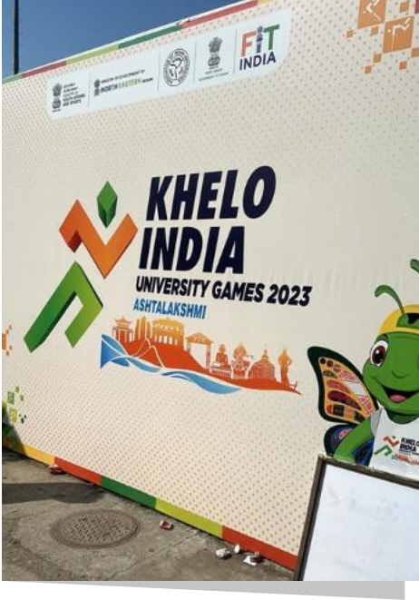
फोटो प्लेट 1: पाल्जोर स्टेडियम में खेले इंडिया यूनिवर्सिटी गेम्स

यह चैंपियनशिप मुक्केबाजी के प्रति बढ़ते उत्साह और विश्वविद्यालय स्तर पर खेलों को आगे बढ़ाने के लिए सिक्किम विश्वविद्यालय और सिक्किम सरकार की प्रतिबद्धता का प्रमाण थी।