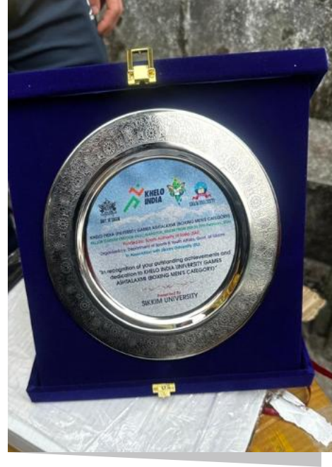
फोटो प्लेट 2: खेल में उत्कृष्टता का जश्र ! सिक्किम विश्वविद्यालय को हमारे प्रतिभाशाली एथलीटों को ये स्मृति चिह्न प्रदान करने पर हमें गर्व है