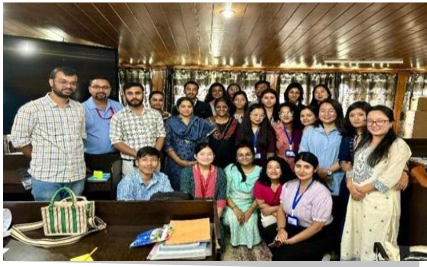
शैक्षिक संसाधन डिजाइन करने पर कार्यशाला