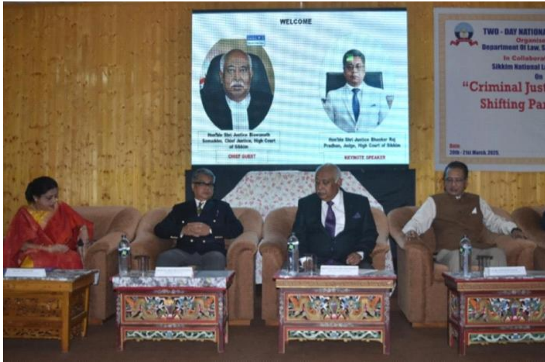
सिक्किम राष्ट्रीय विधि विश्वविद्यालय के सहयोग से विधि विभाग, सिक्किम विश्वविद्यालय द्वारा "भारत में दांडिक न्याय: स्थानांतरण प्रतिमान" पर दो दिवसीय राष्ट्रीय सम्मेलन का आयोजन किया गया।