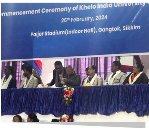
फोटो प्लेट 6: माननीय शिक्षा मंत्री, सिक्किम सरकार और कुलपति, सिक्किम विश्वविद्यालय, खेलो इंडिया यूनिवर्सिटी गेम्स